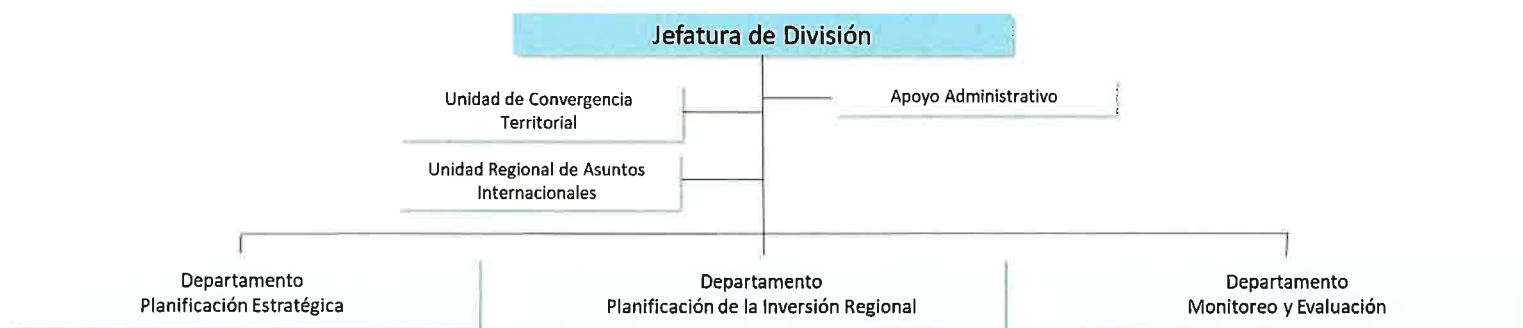
Diagrama N° 1. Estructura Interna de DIPLADE.

La División de Planificación y Desarrollo Regional, mediante Resolución Exenta N° 910, de fecha 10 de septiembre de 2020, aprobó la asignación de funciones y responsabilidades, fijando la estructura interna de la División, para dar cumplimiento a lo dispuesto en la Ley N° 19.175, Orgánica Constitucional sobre Gobierno y Administración Regional, y modificaciones posteriores. A continuación, se presentan su estructura interna: