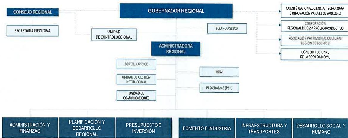
Imagen N°1. Organigrama del GORE de Los Ríos.

La División de Infraestructura y Transportes propuso la siguiente conformación, en base a las definiciones indicadas en las modificaciones a la Ley y las sugerencias establecidas en la “Guía de recomendaciones para la instalación de la nueva orgánica de los Gobiernos Regionales”: