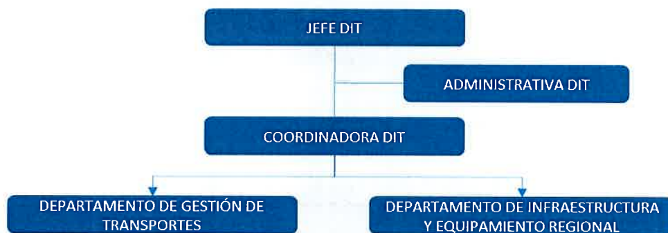
Imagen N°2. Organigrama de la DIT. Elaboración propia.

La División de Infraestructura y Transportes propuso la siguiente conformación, en base a las definiciones indicadas en las modificaciones a la Ley y las sugerencias establecidas en la “Guía de recomendaciones para la instalación de la nueva orgánica de los Gobiernos Regionales”: